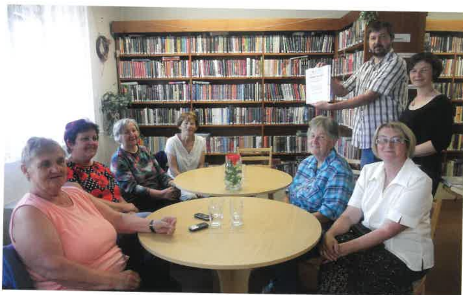
Slavnost předávání Pamětního listu za účast na VÚJZV