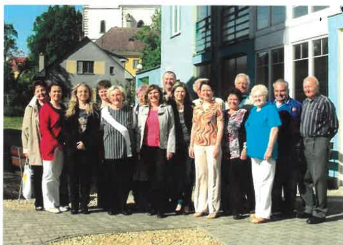
Smíšený pěvecký sbor Stojmír - Bendl