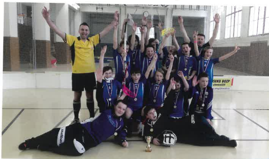
T. J. Sokol Sobotka, družstvo žáků, které získalo 1. místo v Čechách ve florbalu.