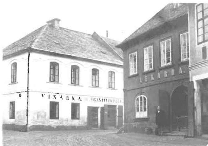
Původní podoba lékárny v Jičínské ulici.