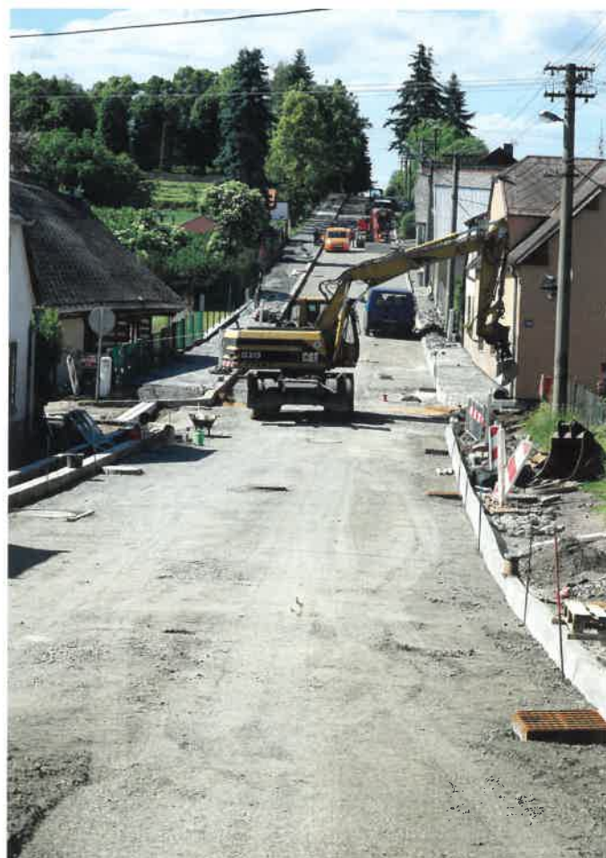
Rekonstrukce ulice Na Celné