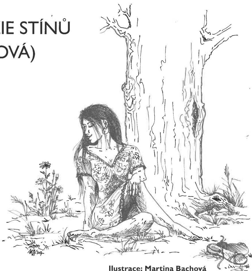
Ilustrace: Martina Bachová

To se mužům často stává, neboť mají fantazii. Slunce svítilo zběsile