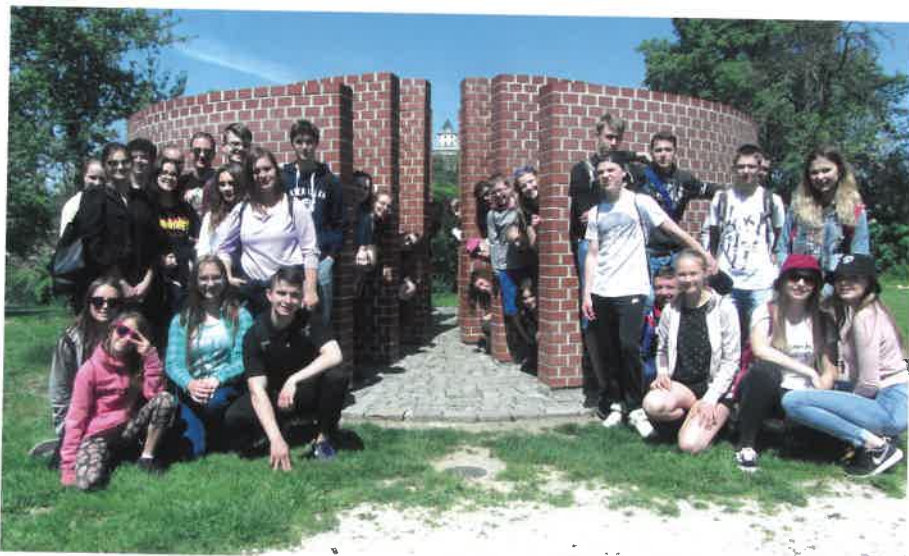
Žáci ZŠ Sobotka a přátelé z polské Sobótky

Kulturní a společenské akce v Sobotce a okolí 27