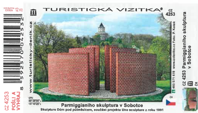
Nová turistická vizitka nejmladší památky našeho města