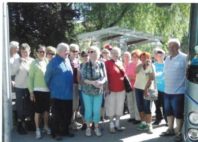
Baráčníci na výletě